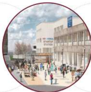
选定为构建首尔校园社区 的事业单位