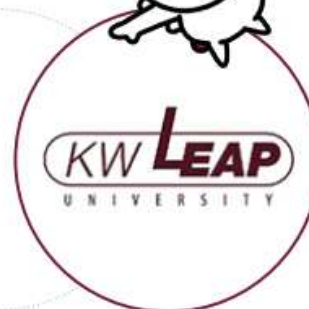
选定为支持大学创新的自 律协议大学事业单位