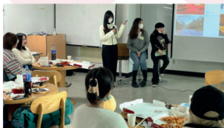
弘益国际人才交流会