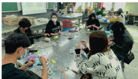
弘益国际人才美术体验课活动